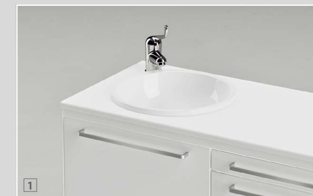
1 Piano in Laminato, sp. 20 mm, lavello inox smaltato (o lavello in ceramica a filo piano) / Laminate worktop, 20 mm thick, glazed stainless steel sink (or flush ceramic bowl) / Plan de travail en Laminé, ép. 20 mm, évier en inox émaillé (ou évier porcelaine collée sous le plan) / Arbeitsplatte aus Laminat, St. 20 mm, Waschbecken aus emailiertem Edelstahl (oder Porzellanwaschbecken bündig mit der Arbeitsplatte) / Encimera de Estratificado, de 20 mm de esp., lavabo de acero inoxidable esmaltado (o lavabo de cerámica a ras de la encimera) 2 Piano in Stratificato, sp. 12 mm, lavello ceramica / Stratified laminate worktop, 12 mm thick, ceramic sink / Plan de travail en Stratifié, ép. 12 mm, évier en céramique / Arbeitsplatte aus Schichtstoff, St. 12 mm, Waschbecken aus Keramik / Encimera de Estratificado, de 12 mm de esp., lavabo de cerámica

TOP AND SINKS | PLANS DE TRAVAIL ET ÉVIERS | ARBEITSPLETTEN UND WASCHBECKEN | ENCIMERAS Y LAVABOS