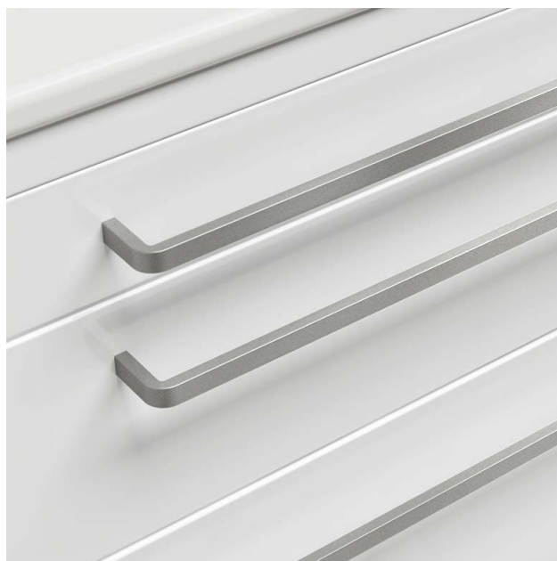
Nuova maniglia in alluminio anodizzato New handle in anodised aluminium / Nouvelle poignée en aluminium anodisé / Neuer Griff aus eloxiertem Aluminium / Nueva manija de aluminio anodizado