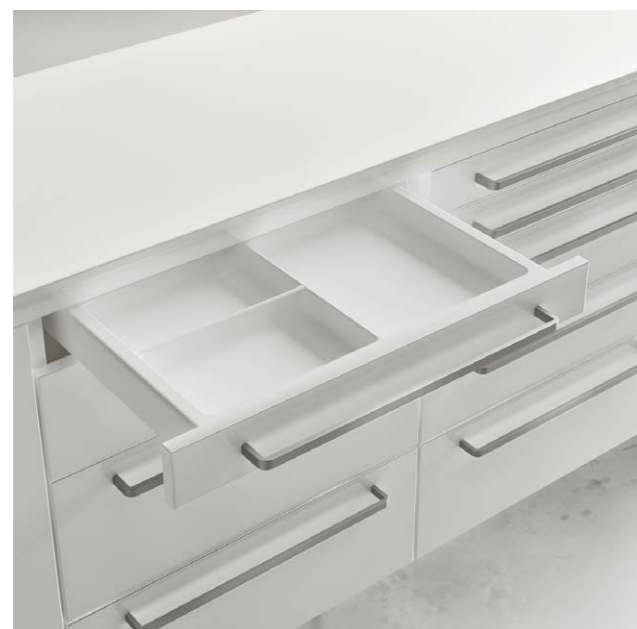
Cassetti con bacinelle facilmente estraibili Drawers with easily removable trays / Tiroirs avec intérieurs facilement amovibles / Schubladen mit leicht ausziehbaren Einsätzen / Cajones con bandejas fácilmente extraíbles

Like è un mobile che nell'essenzialità ha il suo punto di forza. Con basamento chiuso o piedi, è modulabile e soddisfa sempre le necessità del lavoro nello Studio.